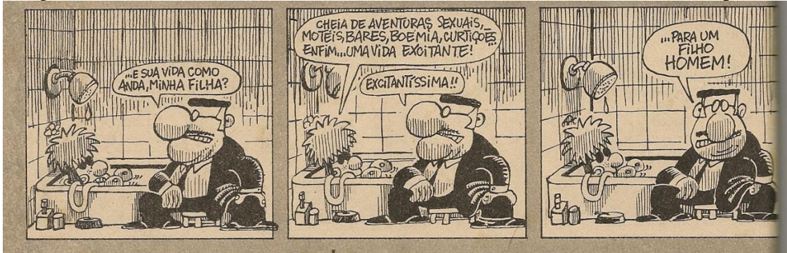
Figura 02.