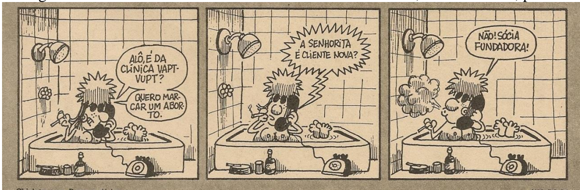
Figura 03.

Por fim, na Fig. 03, partido dos aspectos icônicos da imagem, verificamos novamente uma sequência de três quadros onde uma mulher, fumando dentro de uma banheira, desenvolve um diálogo ao telefone com seu interlocutor. Os diálogos nos