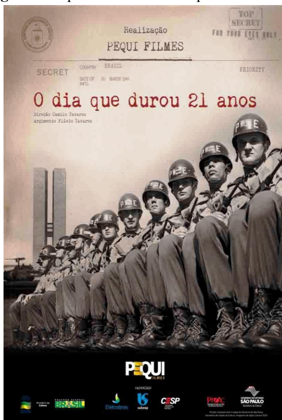
Imagem 2. Capa do DVD “O dia que durou 21 anos”