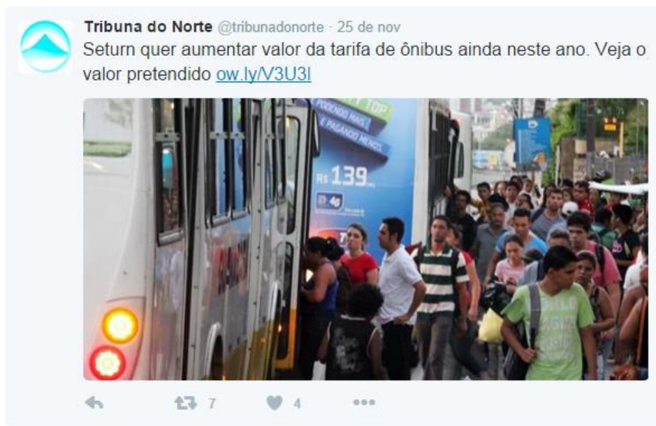
Figura 2 - Print screen retirado da página da Tribuna do Norte no Twitter. 6