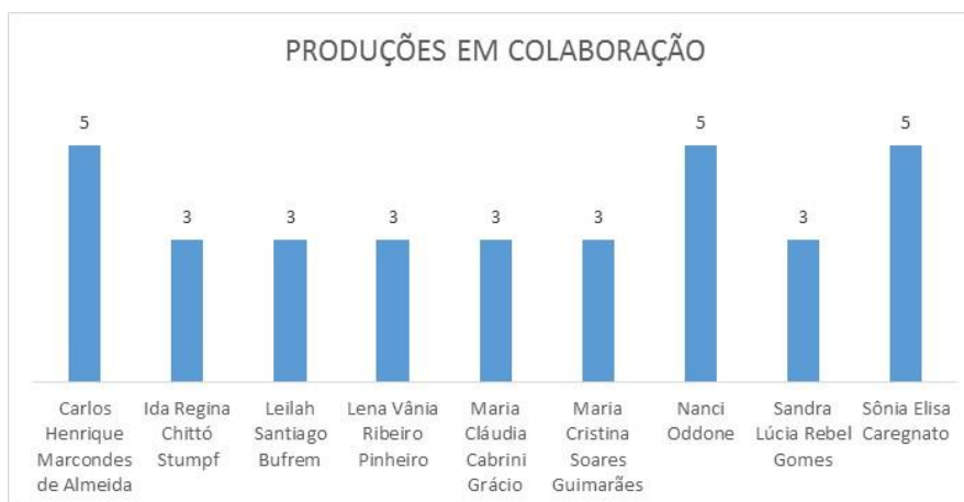
Gráfico 3 – Produções em Colaboração