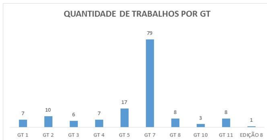
Gráfico 2 – Quantidade de trabalhos recuperados por GT