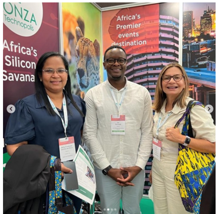
Participação da INOVA em eventos promotores de inovação, tais quais o Pró-líder (esquerda) e Conferência IASP (direita)