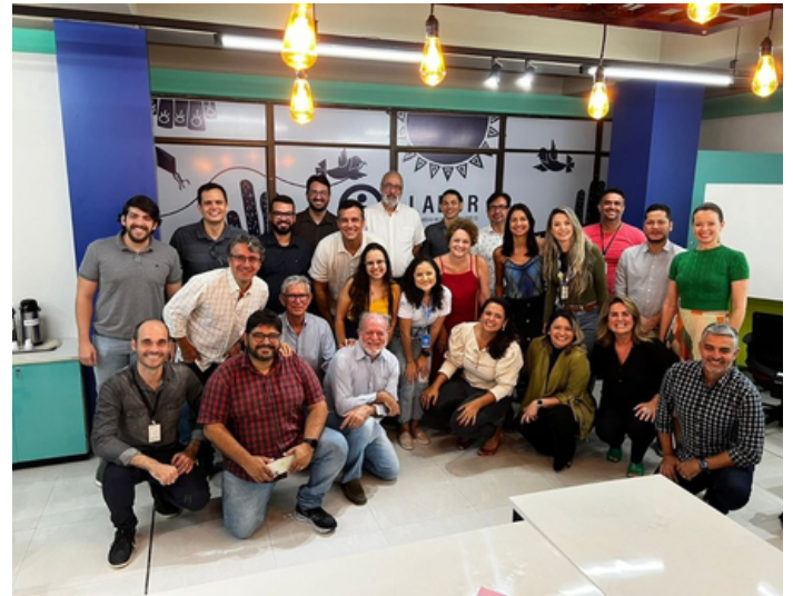
Participação e promoção de eventos de capacitação em inovação e empreendedorismo para a comunidade acadêmica da UFPB