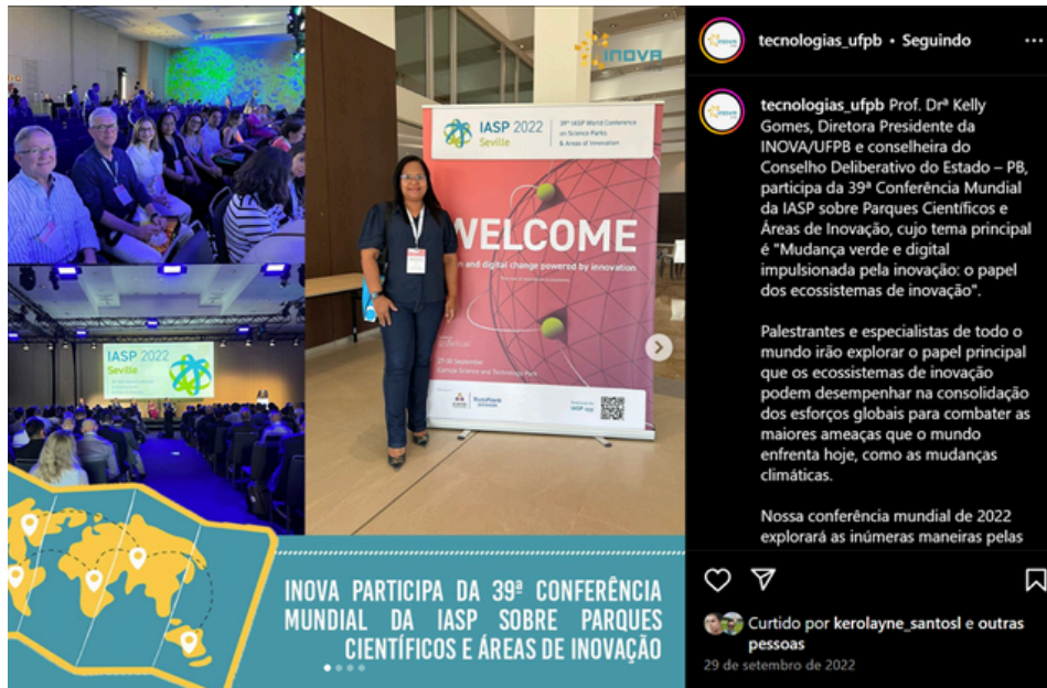
Participação da INOVA na IASP sobre Parques Científicos e Áreas de Inovação