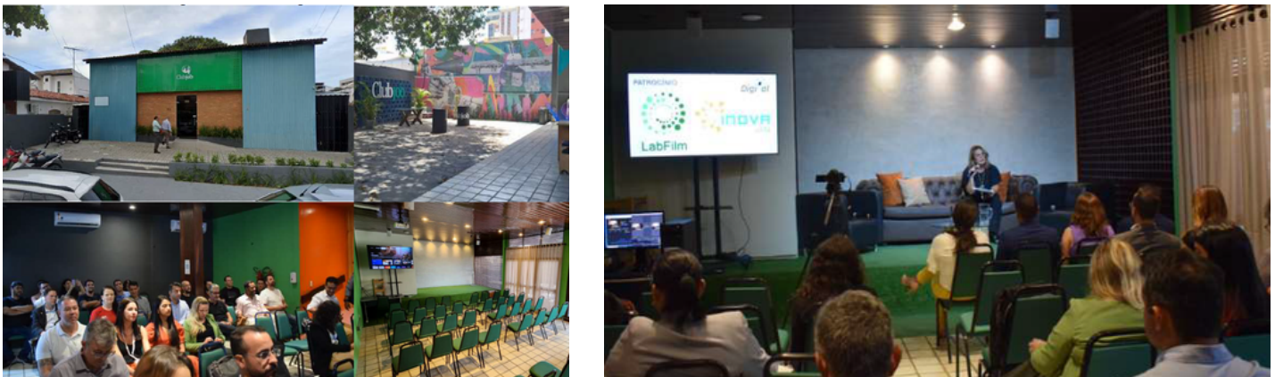
Promoção de visitas a ambientes de inovação (ex.: Club Job) e participação em evento promovido no local com patrocínio do Grupo PETI INOVA/UFPB