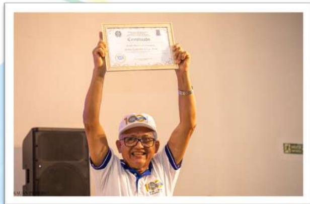
Foto 23. Cerimônia da entrega das Menções Honrosas, CAVN 2024.