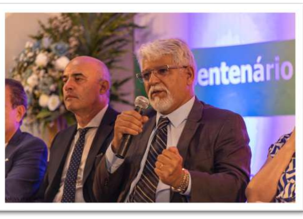
Foto 22. Abertura da Cerimônia da entrega das Menções Honrosas aos Servidores Técnicos; Docentes; Discentes e Terceirizados, CAVN 2024.

A festa do Centenário do Colégio Agrícola Vidal de Negreiros, realizada nos dias 6 e 7 de setembro de 2024, foi um evento memorável que celebrou 100 anos de história, dedicação e compromisso com a educação agrícola no Brasil.