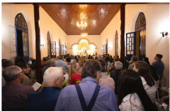
Foto 16. Missa do Centenário do CAVN, 2024.