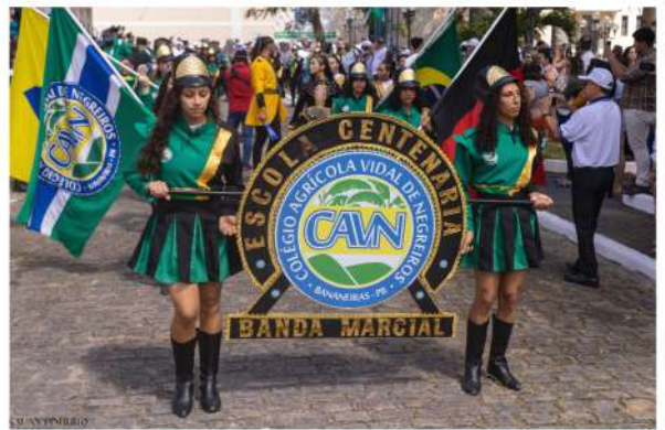
Fotos 18 e 19. Apresentação do Coral na Missa do Centenário do CAVN, 2024.

Estava à toa na vida O meu amor me chamou Pra ver a banda passar Cantando coisas de amor Chico Buarque