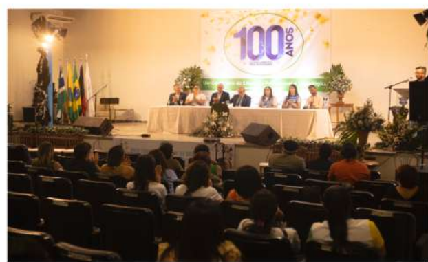
Foto 13. Encerramento do VII Fórum de Ensino Básico e Profissional, CAVN 2024.