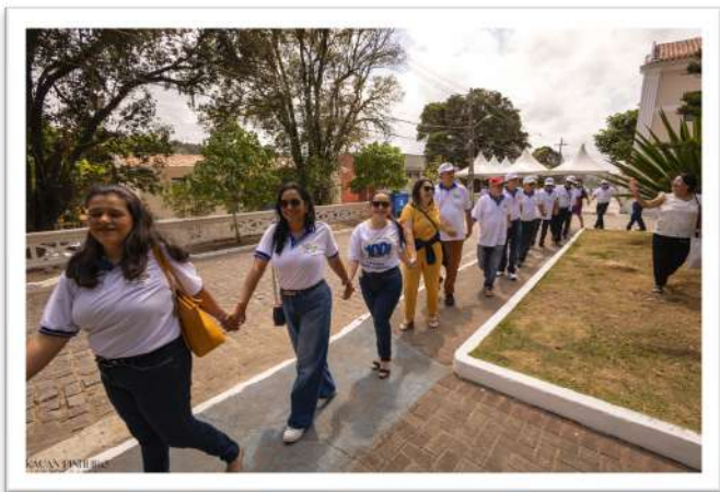
Foto 20. Cerimônia do abraço na Praça do CAVN, 2024.