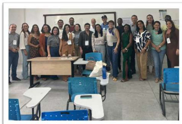
Foto 07. Oficina 01: Experiências exitosas de articulação do ensino, pesquisa e extensão na EPT, CAVN 2024.

Ao longo do dia, mais duas oficinas foram realizadas: Oficina 02: Experiências exitosas no processo de construção da educação inclusiva na EPT e Oficina 03: Metodologias interativas para o ensino na EPT a partir da perspectiva crítico-reflexiva.