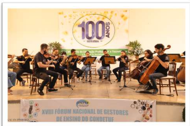
Foto 04. Orquestra Sinfônica da UFPB, CAVN 2024.