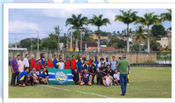
Foto 26. A Coordenação de Esportes do CAVN – COESP, realizou do Tradicional futebol dos Ex-Alunos, no dia 06 de setembro, CAVN 2024.