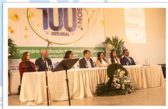
Foto 02. Solenidade de abertura, CAVN 2024.