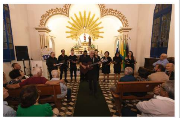
Foto 17. Apresentação do Coral na Missa do Centenário do CAVN, 2024.