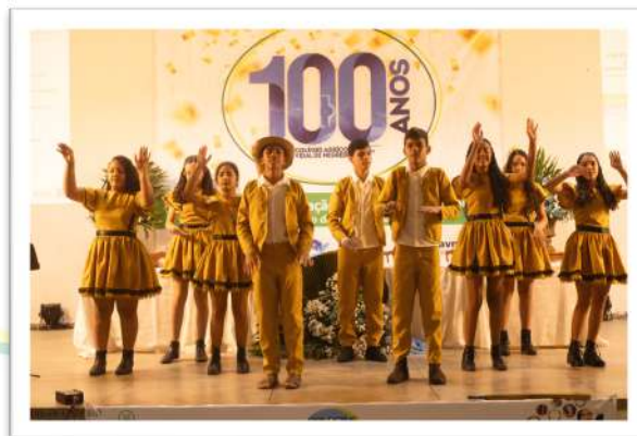
Foto 01. "Suassuna em movimento: A arte armorial em cena, CAVN 2024.

Galeria de Fotos – 04 de setembro (manhã)