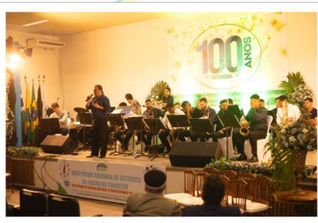
Foto 14. Apresentação da Escola de Música da UFRN, CAVN 2024.