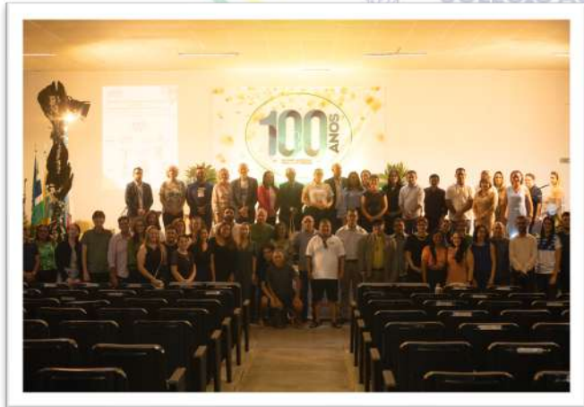
Fotos 09, 10 e 11. Plenária de encerramento, CAVN 2024.