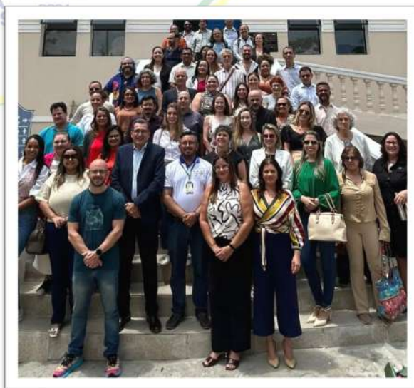
Foto 08. Equipe de Gestores CONDETUF, CAVN 2024.

Ao longo do dia, mais duas oficinas foram realizadas: Oficina 02: Experiências exitosas no processo de construção da educação inclusiva na EPT e Oficina 03: Metodologias interativas para o ensino na EPT a partir da perspectiva crítico-reflexiva.