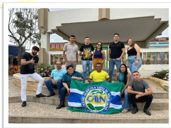
Foto 27. Premiação da Gincantec – 1º lugar Visita Cultural em João Pessoa-PB e o 2º lugar Visita em Areia -PB, CAVN 2024.