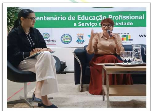
Foto 06. Mesa: A pesquisa como princípio educativo e a curricularização da extensão na EPT, CAVN 2024.