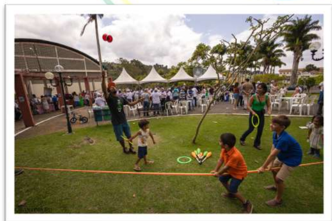
Foto 22. Crianças brincando e lanche compartilhado na Praça do Relógio, Campus III, 2024.

A festa do Centenário do Colégio Agrícola Vidal de Negreiros, realizada nos dias 6 e 7 de setembro de 2024, foi um evento memorável que celebrou 100 anos de história, dedicação e compromisso com a educação agrícola no Brasil.