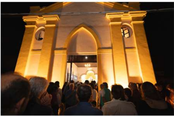
Foto 15. Capela São Francisco, Campus III 2024.

No dia 06 de setembro de 2024, as festividades em alusão ao Centenário do CAVN, deve início com a celebração da Missa na Capela São Francisco, no Campus III. Com a participação da Comunidade Acadêmica e Ex-Alunos.