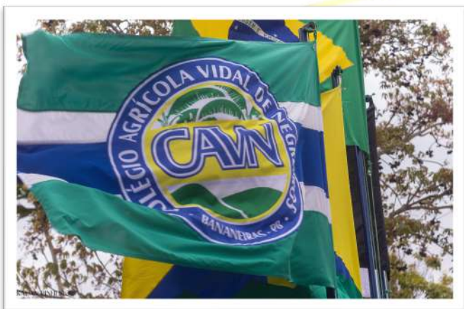
Foto 21. CAVN meu colégio, meu orgulho, 2024.