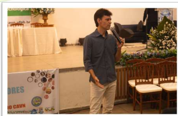
Foto 03. Mesa: Demandas do mundo do trabalho e as ofertas da EPT, CAVN 2024.