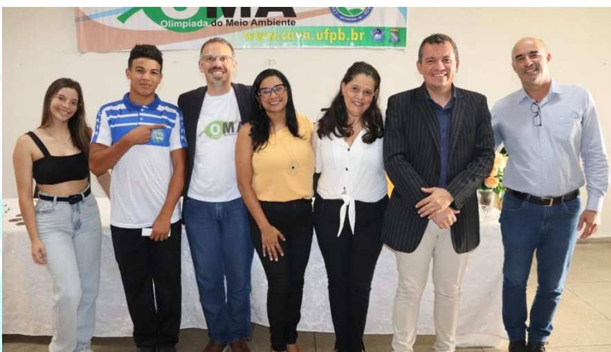
Fotos 22 e 23. VII OMA, CAVN 2023.

Evento 08. Encontro Família e Escola , foi realizado no dia 16 de dezembro e contou com a seguinte programação: Acolhimento e café da manhã, mensagem da Direção do CAVN, avaliação do ano letivo e entrega dos boletins. Na ocasião também houve a entrega de Panetones aos responsáveis. A relação entre família e escola é bastante desafiadora e tem uma interferência positiva no processo de aprendizagem do estudante. Isso porque cada uma das partes tem um papel diferente na construção de conhecimento e formação do indivíduo. Nossos agradecimentos à COPED, CGE e Direção do CAVN.