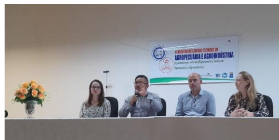
Foto 21. I Encontro dos técnicos em agropecuária e agroindústria, CAVN, 2023.