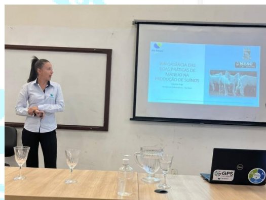
Foto 20. I Dia de campo sobre boas práticas de produção de suínos – UFPB em seu Município, CCHSA e CAVN, 2023.