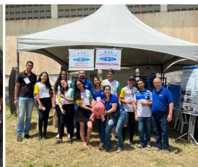
Fotos 1 a 10. Criando memórias EXPOTEC, CAVN 2023.