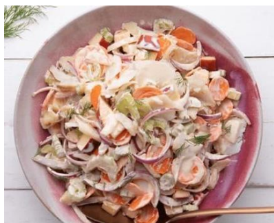
Salpicão de Bacalhau