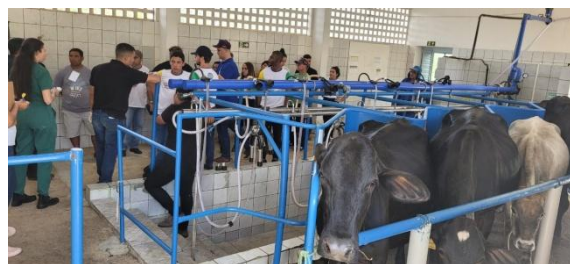
Fotos 14, 15 e 16. I Semana de Capacitação em Ordenha e Qualidade de Leite, CAVN 2023.

além dos colaboradores terceirizados envolvidos na cadeia de produção. A ação integra os projetos de extensão coordenados pela equipe técnica dos laboratórios LABOV e LBL, contando com a parceria do Laticínio Flor do Campo (Tacima-PB). Diante do sucesso da primeira edição, espera-se para 2024 a realização da II Semana. Contamos com o apoio e a presença de todos os entusiastas da cadeia de produção de leite, até lá.