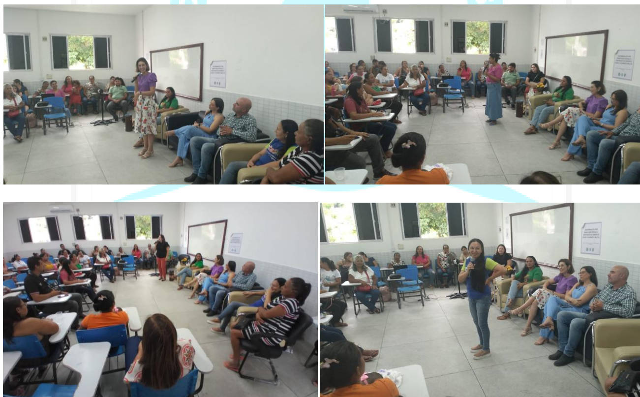
Fotos 34 e 35. Abertura do Programa Mulheres Mil, CAVN 2023.