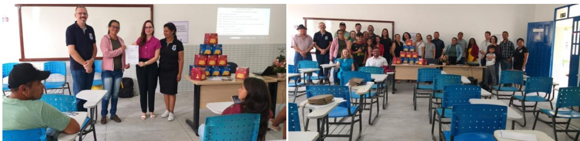
Fotos 24 e 25. Encontro Família e Escola, CAVN 2023.

Evento 08. Encontro Família e Escola , foi realizado no dia 16 de dezembro e contou com a seguinte programação: Acolhimento e café da manhã, mensagem da Direção do CAVN, avaliação do ano letivo e entrega dos boletins. Na ocasião também houve a entrega de Panetones aos responsáveis. A relação entre família e escola é bastante desafiadora e tem uma interferência positiva no processo de aprendizagem do estudante. Isso porque cada uma das partes tem um papel diferente na construção de conhecimento e formação do indivíduo. Nossos agradecimentos à COPED, CGE e Direção do CAVN.