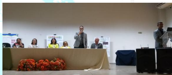
Fotos 11, 12 e 13. I Mostra EJA-EPT, CAVN 2023.

Evento 02. Nos dias 22, 23 e 24 de novembro o Laboratório de Bovinocultura (LABOV), em ação conjunta com o Laboratório de Beneficiamento de Leite (LBL) e com o Laboratório de Reprodução Animal (LARA), realizaram a I Semana de Capacitação em Ordenha e Qualidade de Leite do CAVN/CCHSA/UFPB. O Evento contou com palestrantes do CCA/UFPB (Areia-PB), da UFERSA (Mossoró-RN) e do Rancho Alegre (Natal-RN). Além de discentes de diversos cursos técnicos e de graduação, se fizeram presentes produtores de leite, ordenhadores e vaqueiros oriundos de propriedades leiteiras da região,