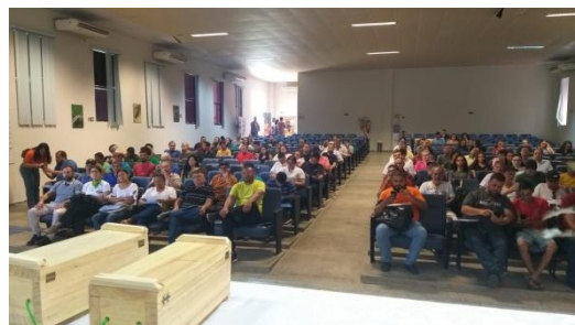
Foto 19. I Seminário Técnico Meliponicultura, CCHSA e CAVN, 2023.