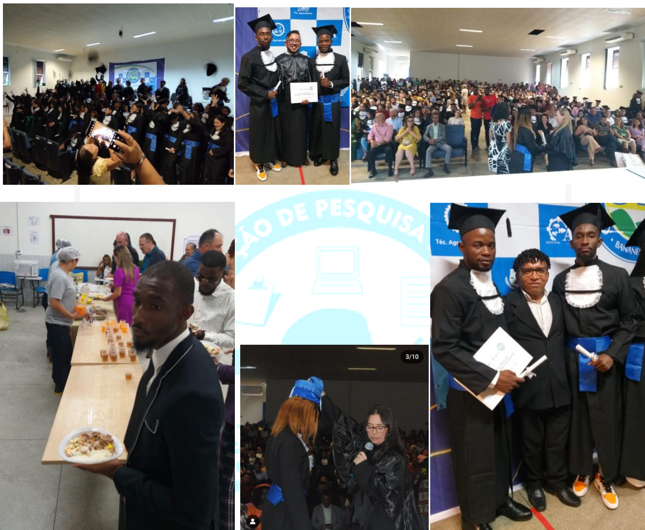
Fotos 26, 27, 28, 29, 30 e 31. Formatura CAVN, 2023.1.

“Tudo começou com coragem, sonhos em nossos corações e um mundo de possibilidades diante de nós. Ao longo dos anos, compartilhamos risos, lágrimas, sucessos e fracassos, e foi isso que fez de nós que somos agora. Mais fortes, unidos e determinados a alcançar os nossos objetivos. Todas as histórias que compartilhamos, as boas e as ruins, ficarão para sempre em nossa memória.”