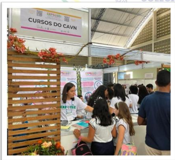
Fotos 02, 03 e 04. EXPOTEC, 2024.