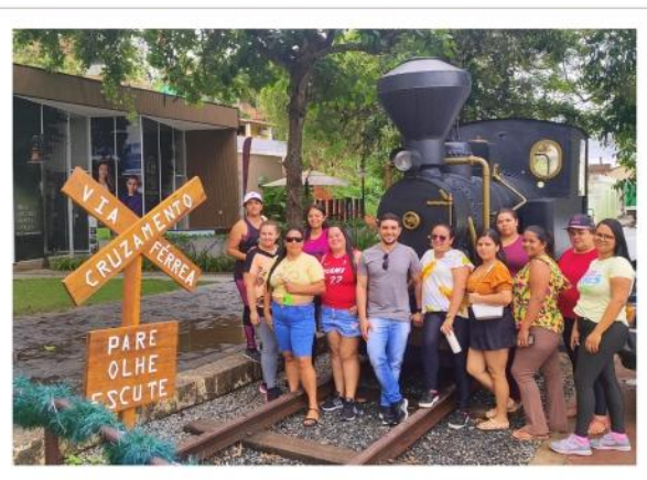
Foto 22. Turmas EJA, CAVN, 2024.