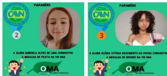
Fotos 05 e 06. Alunas CAVN premiadas na OMA, 2024.

Recebemos 27 escolas de toda a Paraíba, das cidades de Alagoinha, Arara, Areia, Belém, Bananeiras, Borborema, Cabaceiras, Cabedelo, Campina Grande, Casserengue, Catolé do Rocha, Esperança, Guarabira, Ibiara, Itabaiana, Juru, Nova Floresta, Olho D'água, Pitimbu, S. S. de Lagoa de Roça, S. S. do Umbuzeiro, Santa Rita, Solânea, Tacima e Tavares.