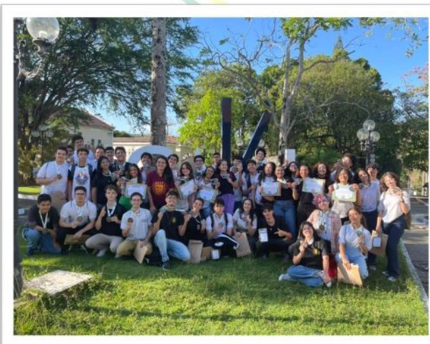
Fotos 07, 08 e 09. Premiação da VIII OMA 2024.