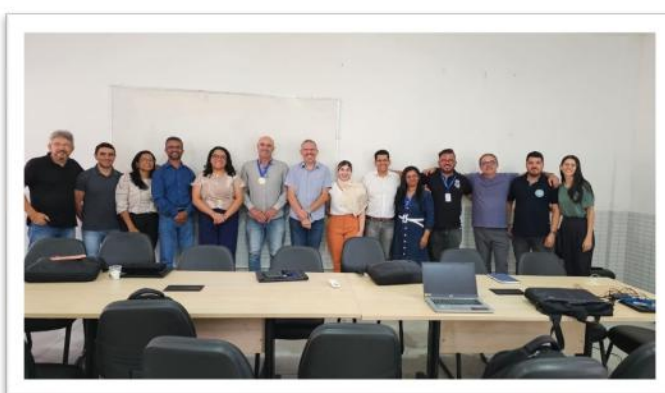
Foto 25. Equipe gestora, 2024.