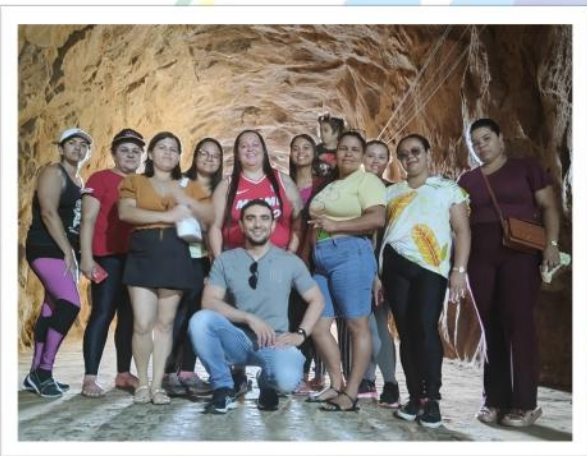
Foto 21. Turma EJA Turismo, 2024.