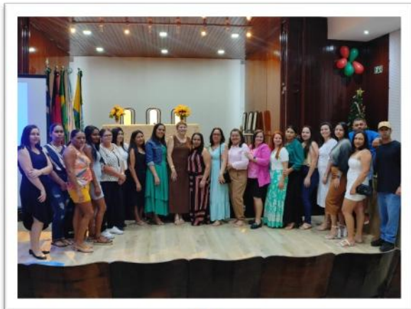
Foto 20. Turma EJA Agropecuária Formação, 2024.