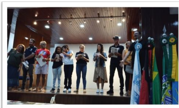
Fotos 10 e 11. Sarau Poético da Consciência Negra, 2024.