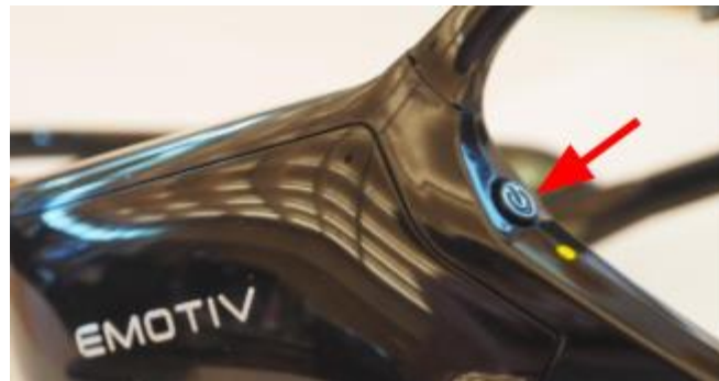
Botão de energia

O fone de ouvido é ligado pressionando o botão liga / desliga localizado entre Pz e a faixa da cabeça; veja a imagem abaixo.