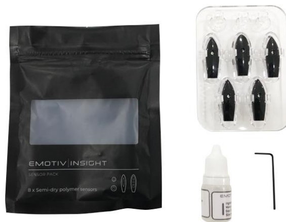
Conteúdo do pacote de sensores INSIGHT

Por favor, localize o pacote de sensores como mostrado abaixo.