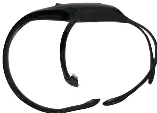
Fone de ouvido INSIGHT

O braço longo é chamado de faixa para a cabeça e é fabricado para atender a uma ampla variedade de tamanhos de cabeça. O braço é inclinado para dentro, de modo que o sensor, quando instalado, esteja em contato com o local T8 e não com o braço de plástico. A faixa para a cabeça pode ser ajustada para usuários com cabeças maiores, onde a faixa fornecida não é confortável. Isso pode ser feito em casa usando um secador de cabelo. O braço é feito de duas camadas separadas de plástico, mas pode ser ajustado aquecendo o plástico com um secador de cabelo até que ele se torne flexível e permita que você ajuste lentamente a faixa da cabeça e ambos precisam estar quentes ou eles podem se separar durante o ajuste.