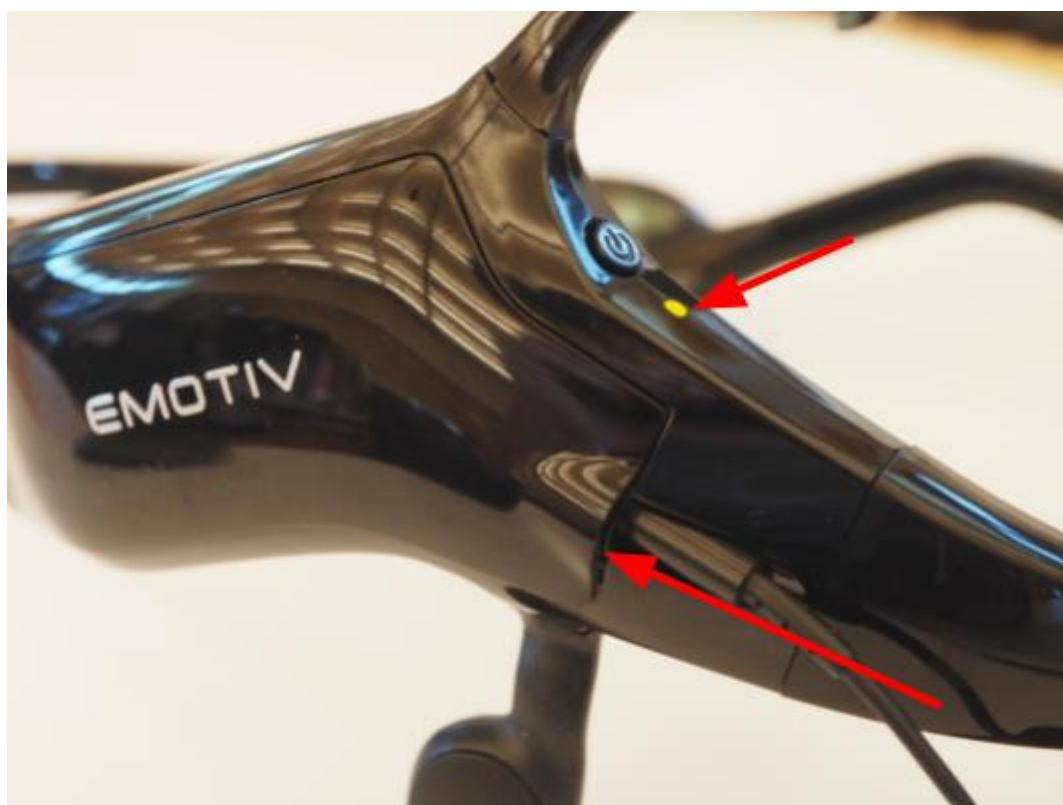
Porta de carregamento e indicador LED

Conecte o cabo ao Insight (veja a foto abaixo), garantindo que o conector esteja totalmente inserido. Conecte o cabo a uma porta USB ativa no seu PC ou carregador. Há um LED vermelho e verde localizado abaixo do botão liga / desliga, que acenderá na cor laranja quando o carregamento e verde quando terminar.