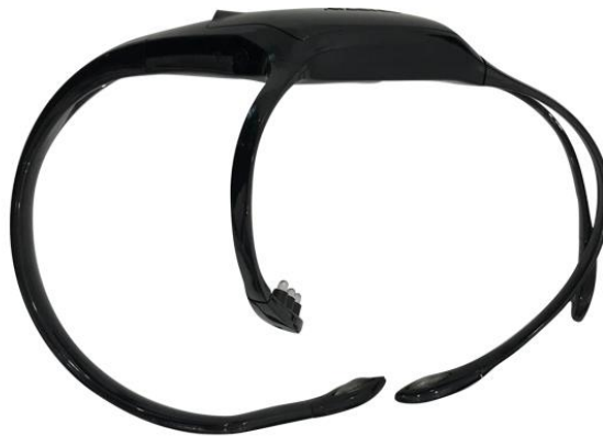
Fone de ouvido INSIGHT montado

O pacote de sensores possui um sensor extra. Para usuários com cabelos grossos, recomendamos o uso do sensor de três pinos. Foi concebido para ter uma melhor penetração dos cabelos e recomenda-se a instalação no braço curto Pz. Mantenha os sensores sobressalentes dentro do pacote de sensores para garantir que eles não sequem. Instale os sensores no fone de ouvido, como mostrado abaixo.