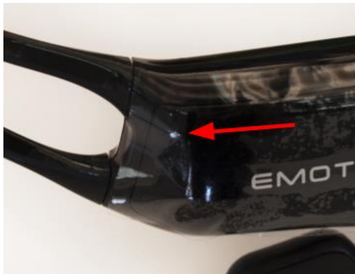
Localização do LED de energia

Quando a unidade está ligada, a luz indicadora branca acende e sua localização é mostrada abaixo. O fone de ouvido agora pode ser conectado ao dongle incluído ou emparelhado ao seu dispositivo via Bluetooth Low Energy (BLE) e começará a transmitir dados.