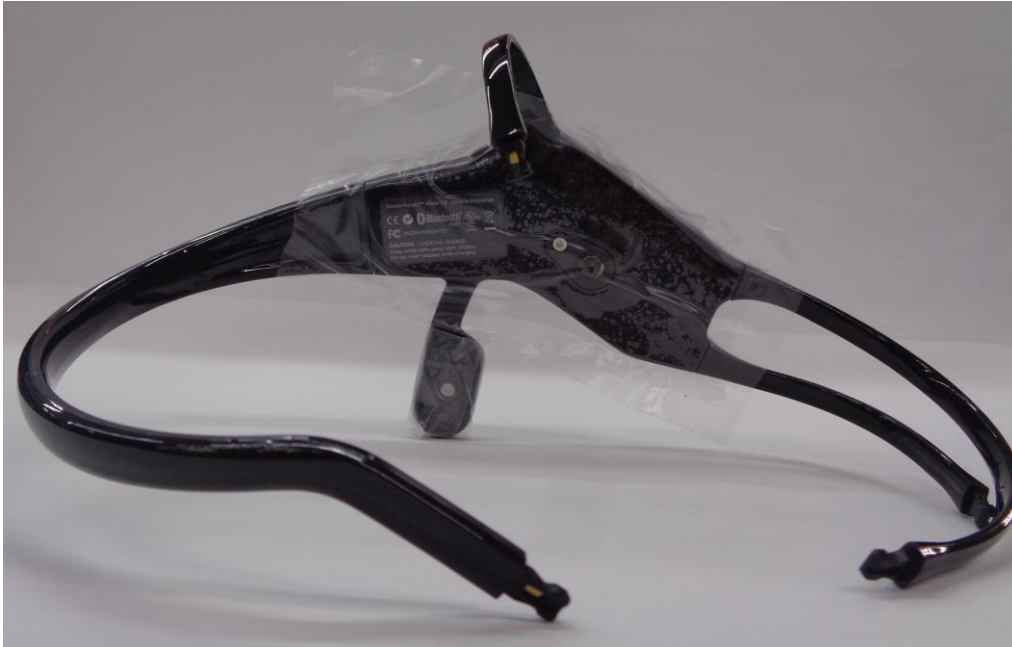
Face interna do fone de ouvido INSIGHT com película protetora fornecida

A instalação do INSIGHT é muito rápida e fácil. Os sensores são feitos de um polímero semi-seco. Se não estiverem em uso, devem ser mantidos no suporte do sensor na bolsa com zíper. Para facilitar a instalação, montamos os sensores para o T7 e o braço de referência e os cobrimos com uma película protetora. Por favor, remova o filme plástico.