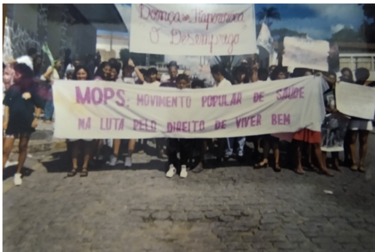
Foto 7. Mobilização reivindicando água e energia na comunidade Sítio Engenho Novo, em Mamanguape-PB (1994).

Decidimos, então, realizar uma passeata. Tivemos apoio de um deputado e do sindicato. Além da pauta da água, incluímos a questão da energia também.