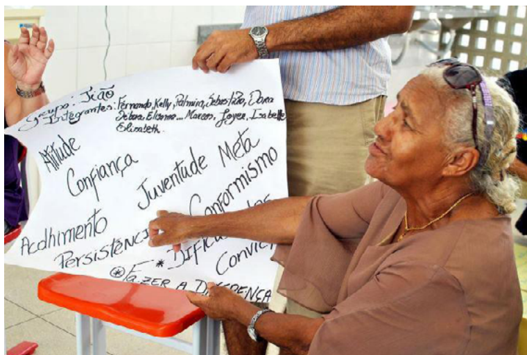
Foto 29. Participação em Curso de Educação Popular para o Trabalho Social em Comunidades, em Jacaraú-PB (2016).

Desvelar essa história é também uma maneira de valorizar e reconhecer o trabalho desempenhado por essa Educadora Popular para que seja referenciada por suas ações e sabedorias e que seu trabalho sirva de inspiração para aqueles que buscam conhecimento na área. Contudo, torna-se necessário ampliar as reflexões acerca de sua trajetória. Dessa forma, pretende-se que esse trabalho seja base para a construção de um livro onde tais aspectos serão aprofundados.