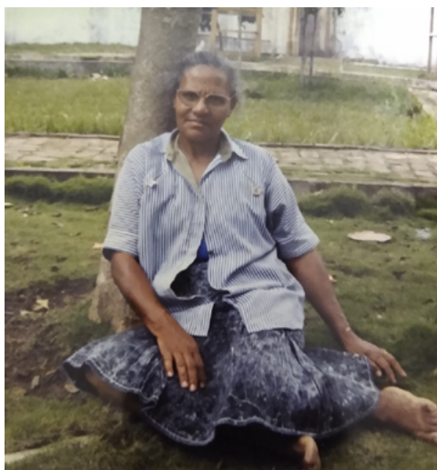
Foto 15. Momento de lazer na piscina de Sertãozinho no município de Mamanguape-PB (1989).

No início da minha trajetória, eu pensava que quando se falava em saúde era apenas a saúde do corpo. Curar a dor que está ali, a dor de cabeça, por exemplo. Depois que entrei no MOPS, mudei minha visão. Para que eu tenha saúde, é preciso uma casa digna de morar; é ter uma terra para trabalhar; se moro na cidade, é ter saneamento básico na minha porta, ter água, ter energia, ter lazer, saúde e estar bem com a vida. Minha visão de saúde hoje é essa, não é somente a saúde do corpo. Saúde envolve tudo isso, envolve a sobrevivência sem passar necessidade.