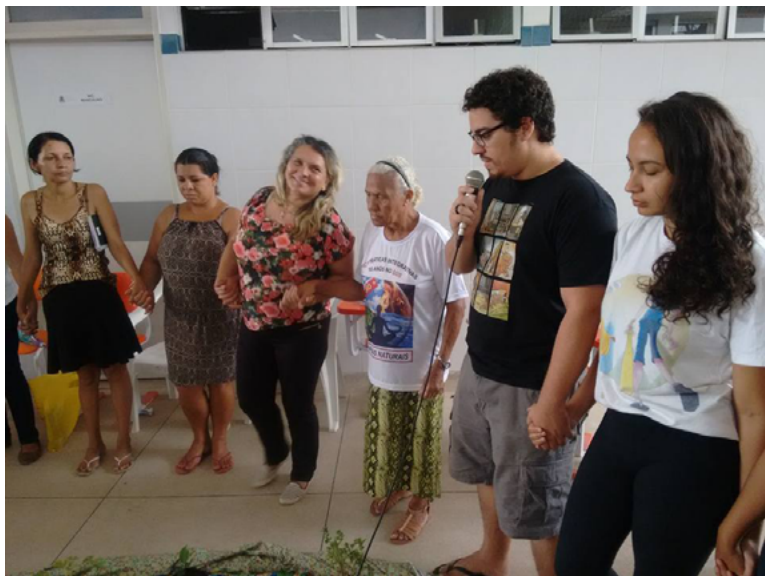
Foto 21. Oficina de Fitoterapia na Unidade de Saúde da Família Vila Saúde, em João Pessoa-PB (2017).