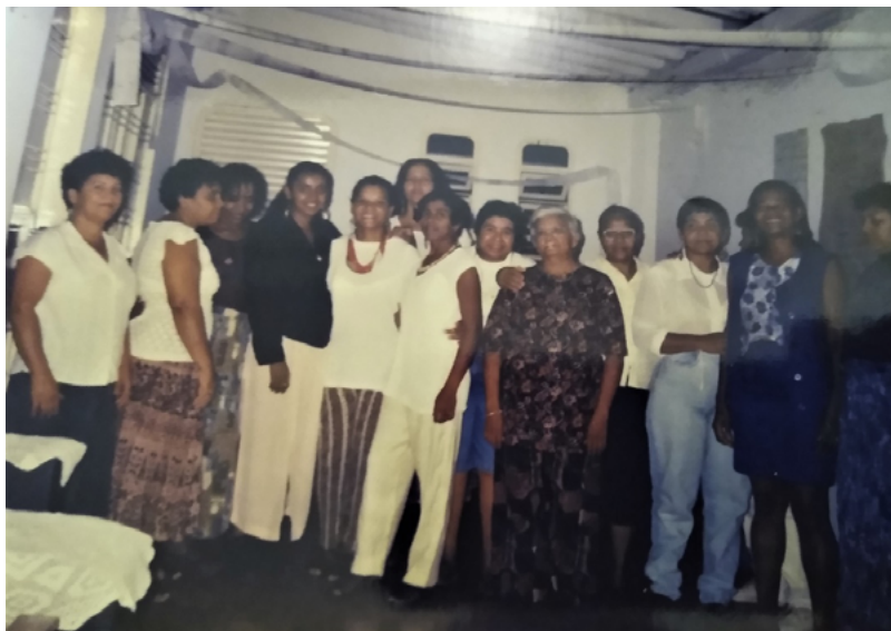
Foto 10. Encontro dos coordenadores do MOPS em Brasília-DF (1992).

Para mim, parte importante do trabalho comunitário é sempre estar atenta e disponível para participar das iniciativas que pessoas e entidades do bairro propunham realizar. Foi nesse sentido, por exemplo, que a Pastoral da Criança chegou, em 1987, na Paraíba e na minha comunidade. Inicialmente, recebi um recado do diretor da Paróquia Nossa Senhora do Rosário mandando me chamar. Chegando lá, ele relatou a chegada de um trabalho para com as crianças e me chamou para um treinamento. No mês seguinte, recebi o recado do diretor da paróquia: “A nossa Paróquia foi escolhida para implantar a Pastoral da Criança, está disposta a trabalhar?” .