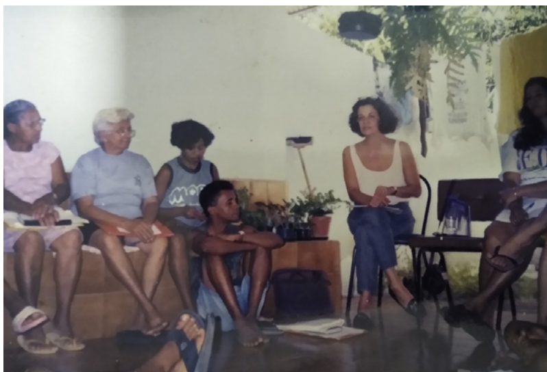
Foto 8. Encontro dos coordenadores nacionais do MOPS em Brasília-DF (1992).

Com o MOPS, lutávamos pela necessidade do povo, vindo a saúde de forma geral. Então, trabalhávamos o tema que fosse preciso para a comunidade como moradia, água, alimentação, direito à saúde, valorização das práticas populares, entre outros. De dois em dois anos, eram realizados encontros nacionais onde vinham pessoas de vários estados do Brasil trocar experiências. Isso somou muito no meu saber popular, além de ter agregado conhecimentos sobre a medicina alternativa. Quando eu abraçava mesmo uma experiência, eu chegava na minha comunidade e tratava logo de botar em prática o que tinha aprendido.