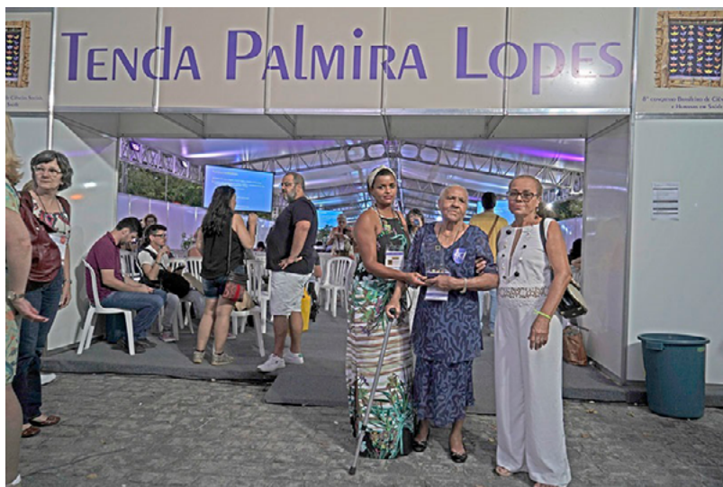
Foto 20. Momento em frente a Tenda Palmira Lopes, que constituiu homenagem do 8º Congresso Brasileiro de Ciências Sociais e Humanas em Saúde, em João Pessoa-PB (2019).

não nos acomodarmos e ficarmos sentados como meros observadores dessa lamentável realidade. Temos que continuar lutando, encontrando-nos em coletivo e passando com coragem nossos conhecimentos de cunho popular, comunitário e social, enfocando insistentemente no que achamos que deve ser feito para o bem da humanidade e para a realização irrestrita dos anseios de felicidade, de dignidade e de vida plena para todas as pessoas, sem qualquer tipo de exceção ou de discriminação.