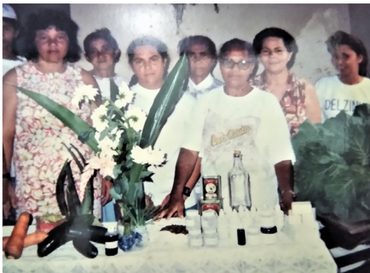
Foto 14. Curso de remédios caseiros de plantas medicinais na comunidade de Capim no município de Mamanguape-PB (1998).

A experiência de lidar com as plantas medicinais e fitoterapia nas práticas populares ensinou-me que a ancestralidade, a postura de aprendiz eterno e as trocas de experiências são condições obrigatórias, sem as quais não desenvolvemos um saber adequado para cuidar das pessoas e da comunidade.