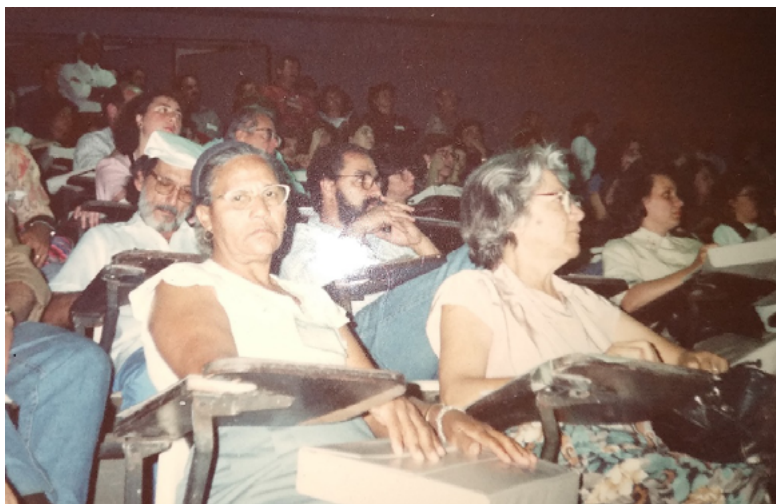
Foto 9. Participação na 8ª Conferência Nacional de Saúde, em Brasília-DF (1986).

Através do MOPS, participei da 8ª Conferência Nacional de Saúde, em Brasília, em 1986. Nessa época, o movimento discutia a criação do SUS, pois era um sistema que iria dar direito à saúde para aquelas pessoas que não pagavam o INSS, já que essas eram desassistidas e tinham o acesso a serviços de saúde prejudicado ou inexistente.