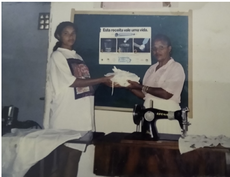
Foto 11. Entrega de enxoval as mães da Pastoral da Criança na comunidade Bela Vista no bairro do Cristo Redentor, João Pessoa-PB (1982).