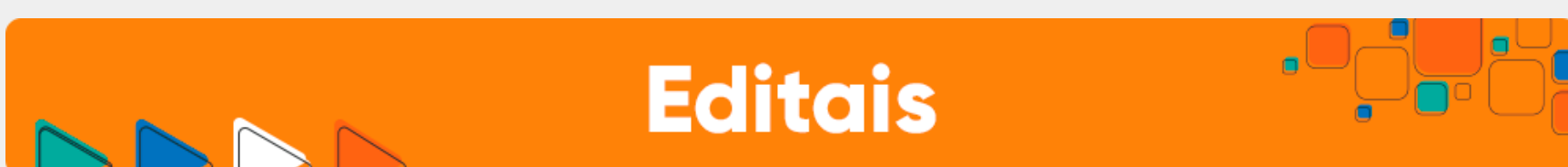
Imagem 6: banner de editais