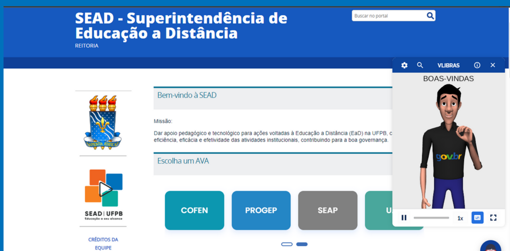
Imagem 4: Site da SEAD com o recurso do V-LIBRAS ativo

O V-Libras é uma solução desenvolvida pelo Laboratório de Aplicações de Vídeo Digital (LAVID) da Universidade Federal da Paraíba, para tornar a comunicação com pessoas surdas mais acessível e eficiente, permitindo que elas compreendam informações e interajam com textos e multimídia, por meio da língua de sinais.