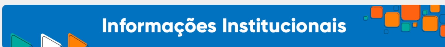
Imagem 9: banner de informações institucionais