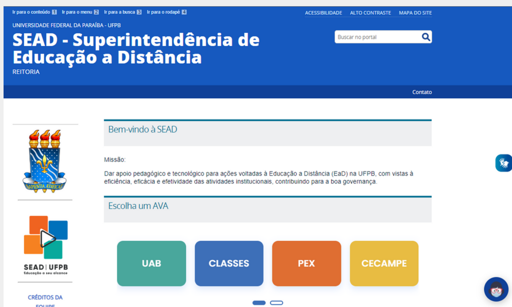
Imagem 1: Site da SEAD - parte da página inicial

Entre os grupos beneficiados com o alto contraste podem-se citar os deficientes visuais, pois a ferramenta torna o conteúdo mais legível e perceptível, e os daltônicos, uma vez que ela torna os elementos mais discerníveis.