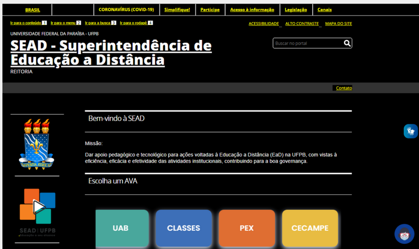
Imagem 2: Site da SEAD com o recurso do alto contraste ativo